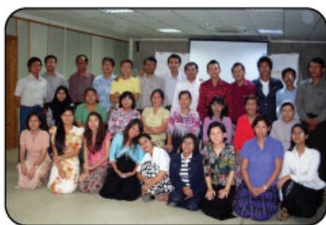
"Complaint Handling & Response Mechanism Training on 17-19 August 2011 at LRC"