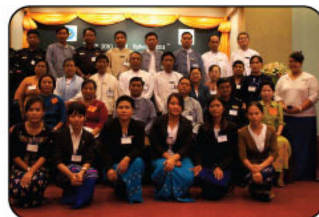
"HAP 2010 & Sphere 2011 Introduction Workshop on 13 July 2011 at Nay Pyi Taw"

Oxfam, LRC and Myanmar Red Cross Society cooperated and facilitated the HAP 2010 & Sphere 2011 Introduction Workshop on 13 July 2011 at Nay Pyi Taw for 30 Government Officials from Ministry of Social Welfare, Relief & Resettlement, Ministry of Home Affairs, Ministry of National Planning and Economic Development and Ministry of Health.