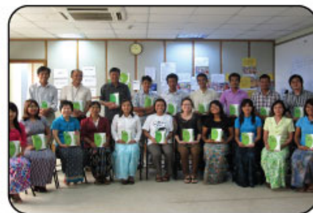
"Sphere 2011 Training on 30-31 August at LRC"